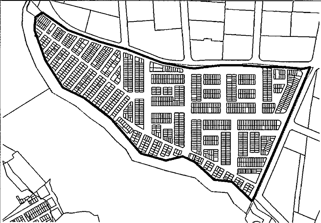
Predios Plan Parcial Engativá 47

PREDIOS INCLUIDOS EN EL ÁREA PREDELIMITADA